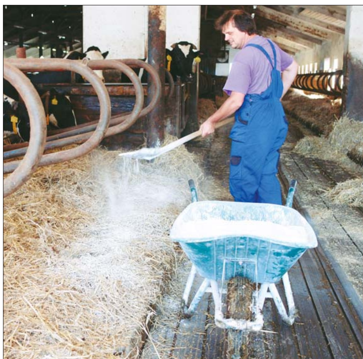
Aplikace Valurmixu je jednoduchá. Může být jak zautomatizovaná (zastýlací vozík), tak ruční. Důležité je, aby jím byly ošetřené především zadní části lehacích boxů, kde má kráva položené vemeno

Valurmix je stelivový posyp z různých minerálních složek. Jeho základní složkou je uhličitán vápenatý, který při aplikaci statkových hnojiv (v kterých je po aplikaci obsažen) upravuje pH zemědělských ploch, jež jsou často výrazně překyselené. Přípravek VALURMIX je vhodný zejména jako posyp do lehacích boxů, kde účinně redukuje počty patogenů a povrchově zvyšuje alkalitu až nad hranici 11° pH. Například zástupci rodů Klebsiella a Pseudomonas , kteří si často vytvářejí účinné bariéry proti komerčním přípravkům antibiotik, jsou na vysoké pH citlivé a lze eliminovat jejich zásadní vliv.