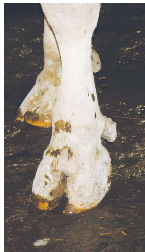
Při pravidelné a správné aplikaci má Valurmix velmi dobrý účinek na kondici paznehtů