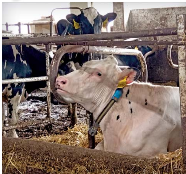
Systémy monitorují říjové chování, aktivitu a přežvykování. Životnost baterie je sedm let

„Pomocí dat v reálném čase systém přesně a spolehlivě vyhodnocuje ak-