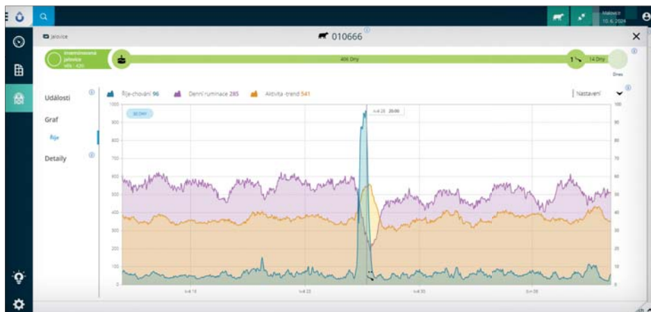
Na grafu je přehledně vidět pokles ruminace (fialová barva) a zvýšení pohybové aktivity (žlutá barva), indikující říji (modrá barva)

„Plemenic v říji nebo ty vyžadující pozornost můžeme identifikovat dříve než obvykle, při použití standardních pracovních postupů. To nám umožňuje